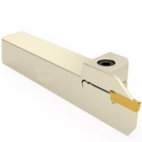
Резьбовые для наружные